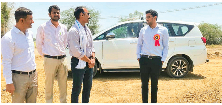
हरिभूमि न्यूज ►► हरदा